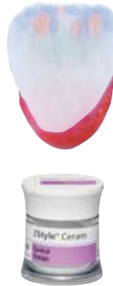
CT yellow, CT orange-pink, CT khaki, CT orange

The IPS Style Ceram Cervical Transpa materials reproduce the shades with a more intensive translucency and support the natural transition from the gingiva to the veneer.