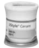
A-O Margin, A-O Dentin, A-O Incisal, A-O Bleach, A-O 690°C