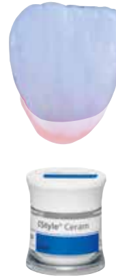
I BL, I 1, I 2, I 3, I 4, I 5

The IPS Style Ceram Incisal materials are modelled according to the natural incisal material. In combination with the Dentin materials, they help achieve the correct A–D shade.