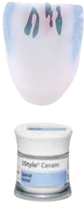
SI yellow, SI grey

The IPS Style Ceram Special Incisal materials may either be mixed with IPS Style Incisal materials to modify and intensify the shade or applied directly.