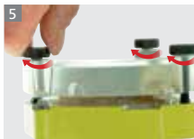
Screw down alternately