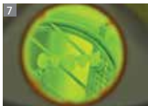
Without flask Ohne Küvette