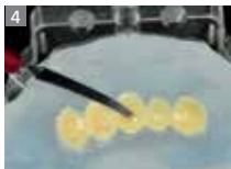
SR Nexco Dentin