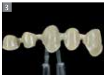
SR Link SR Nexco Opaquer