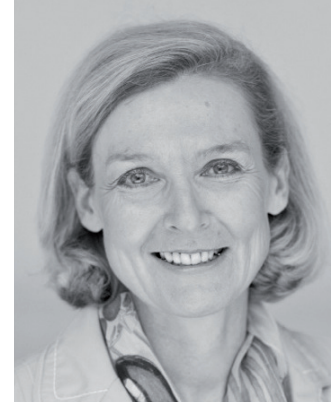
Dr Sabine Hopmann Lemförde, Alemania

"Esta paciente es un excelente ejemplo de cómo unos dientes atractivos y un cambio de estilo pueden influir en la personalidad de un individuo. El encanto natural de esta paciente se mejoró con las restauraciones dentales creadas individualmente. Los dientes SR Phonares II permiten una interminable variedad de formas y posiciones. Además, el sistema IvoBase asegura un encaje optimizado en la base de la dentadura, lo que contribuye a la comodidad de la masticación y el habla del paciente. La paciente está claramente satisfecha con sus nuevos dientes."