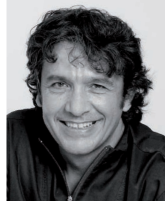
Dr Piero Venezia Bari, Italia

"La paciente recibió una dentadura completa en la mandíbula superior e inferior. Gracias a la nueva gama de dientes SR Phonares II y al sistema IvoBase, la dentición se restauró estética y funcionalmente. Hoy, la joven paciente está capacitada para llevar una vida social normal una vez más."