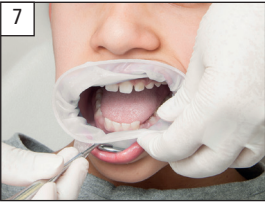
7. Position OptraGate in the lower vestibular region. Einsetzen ins untere Vestibulum.