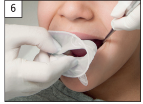
6. Place OptraGate in the left corner of the mouth. Einsetzen in linken Mundwinkel.