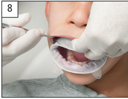
8. Position OptraGate in the upper vestibular region. Einsetzen ins obere Vestibulum.