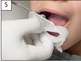
5. Place OptraGate in the right corner of the mouth. Einsetzen in rechten Mundwinkel.