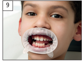
9. Optimally placed OptraGate Optimal eingesetzter OptraGate.